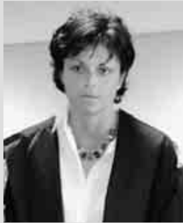
IL SOSTITUTO PROCURATORE DI LAZZARO