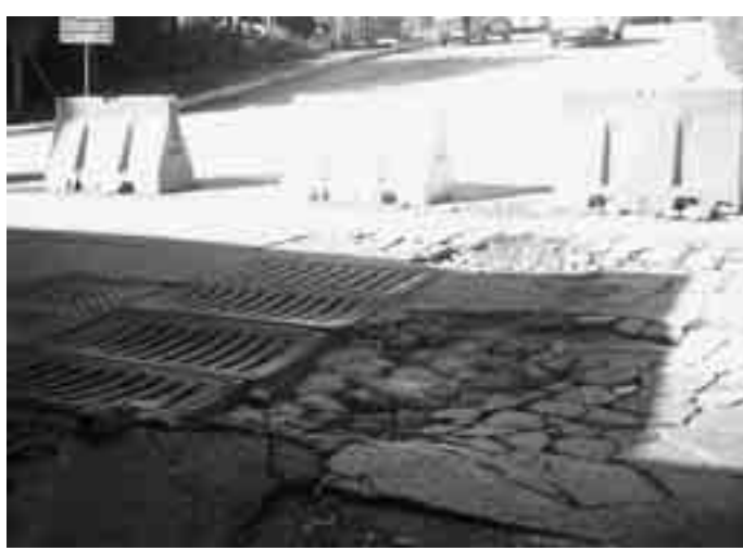
TROPPE STRADE DISSESTATE IN PAESE